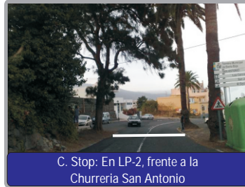
C. Stop: En LP-2, frente a la Churreria San Antonio