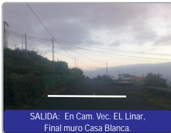
SALIDA: En Cam. Vec. EL Linar, Final muro Casa Blanca.