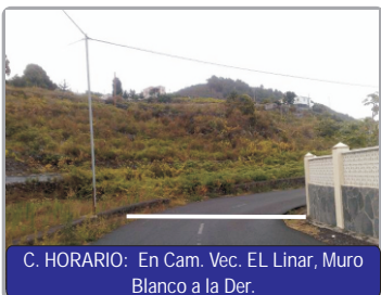
C. HORARIO: En Cam. Vec. EL Linar, Muro Blanco a la Der.