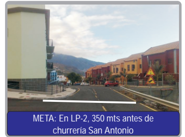
META: En LP-2, 350 mts antes de churreria San Antonio