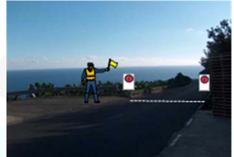
SALIDA FRENTE ALMACEN