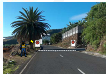
META FRENTE PALMERA